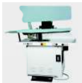
FPA3-D prensa de pantalones