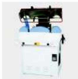
FPA6-WC prensa de cuellos y puños