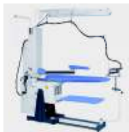
FIT2WC mesa de planchado

Excelencia exclusiva en el Servicio Siempre cerca. Siempre a su disposición.