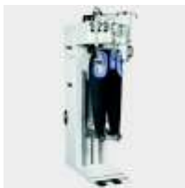
FTT1 topper pantalones