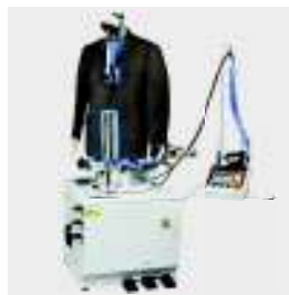
FFT-D Maniquí de americanas