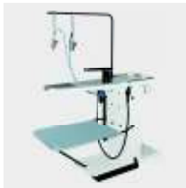
FSU1 mesa desmanchadora

Una amplia gama de opciones y accesorios (carros, bases, unidades de condensación, etc)