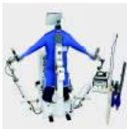
FFT-S Maniquí de americanas