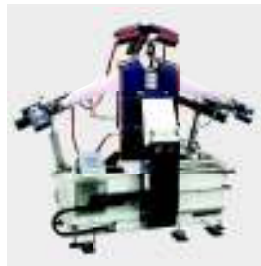
FSF3 Maniquí de camisas