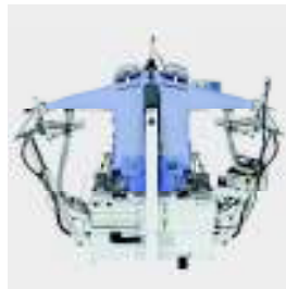
FSF2 Maniquí de camisas