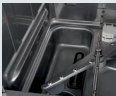
Ángulos redondeados para facilitar la limpieza